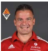
Trainer Thomas Tech 0172/8280920