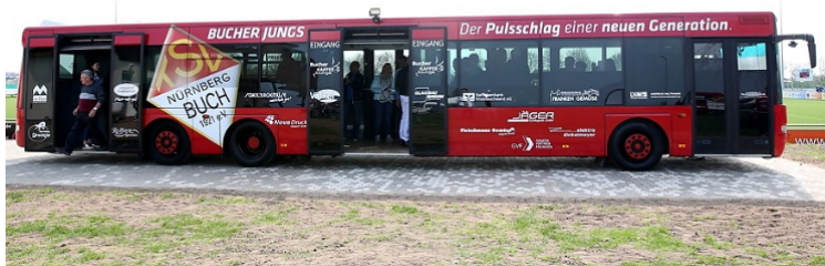
Die neuen Mannschaftsbusse des TSV Buch